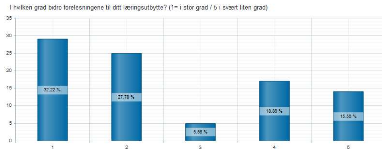
Tabell 1 – Læringsutbytte av forelesningene

Fra noen studentenes side ble det trukket frem at foreleseren burde brukt powepoint i stedet for tavleundervisning, mens mange andre mente dette var svært bra. Bruk av øvingsspørsmål og eksempler trekkes frem av studentene som veldig positivt. Videre oppfattes emneansvarlig som kunnskapsrik og engasjert. Mange studenter på forelesningene og dårlig lokale (Auditorium U.Pihl) kommenteres, sammen med mangelen på distribusjon av notater etter forelesningene, som punkter til forbedring.